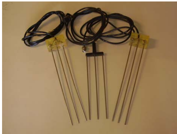
Figura 1. Exemplares de sondas TDR utilizadas no experimento.

A Figura 1 mostra três exemplares de sondas utilizadas neste experimento, sendo a central uma sonda original e as laterais sondas manufaturadas pela equipe.