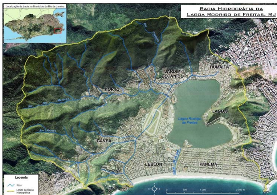
Figura 1. Bacia Hidrográfica da Lagoa Rodrigo de Freitas.

Historicamente a Lagoa Rodrigo de Freitas tem sido cenário de eventos de mortandade maciça de peixes e inundações, somado a um quadro de grande degradação da qualidade de suas águas. Rosso (2008) aponta a intensa ocupação urbana da bacia hidrográfica, associada à evolução das ações antrópicas sem observância de normas elementares de urbanismo, de regras básicas para o saneamento ambiental, notadamente dos sistemas de esgotamento sanitário e de drenagem urbana, como causadores dos problemas observados. Diversas administrações da cidade realizaram aterros na Lagoa, muitas vezes como medida de higienização e saneamento das áreas, alterando seu contorno, mas embora o espelho d'água tenha sido amplamente reduzido, a Lagoa foi a única que sobreviveu a este processo de expansão urbana na região da zona sul da cidade (Loureiro, 2006).