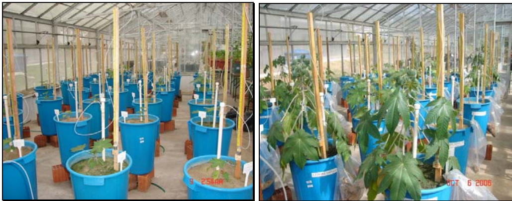
Figura 1. Visão geral no início e no final do experimento na casa de vegetação da Embrapa Algodão.

O experimento se desenvolveu em vasos plásticos, de modo que cada unidade experimental correspondeu a um vaso com capacidade de 60 L com diâmetro inferior de 27 cm, superior 41 cm e altura de 57 cm; foram utilizados 45 vasos sob uma base de tijolo para facilitar a drenagem (Figura 1). Em cada vaso foi instalado um tensiômetro (Figura 1) a uma profundidade de 30 cm da superfície do solo, com o objetivo de se determinar o momento da irrigação e o volume de água a ser aplicado, o qual era calculado por uma planilha de Excel em função da leitura do tensiômetro.