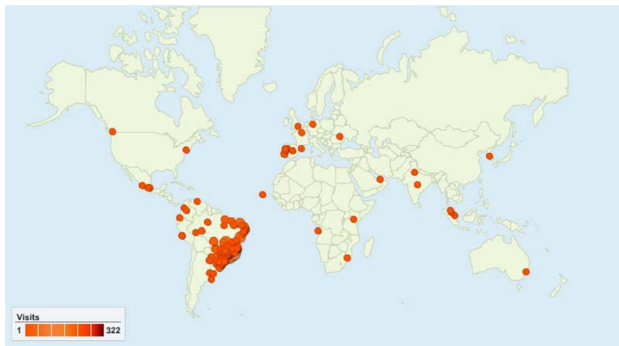
Figura 2. Distribuição espacial das 616 cidades de onde se originaram as consultas à revista Ambi-Água no período de dois meses (15 de junho a 15 de agosto de 2008).

As cidades que mais consultaram a revista são identificadas na Tabela 1.