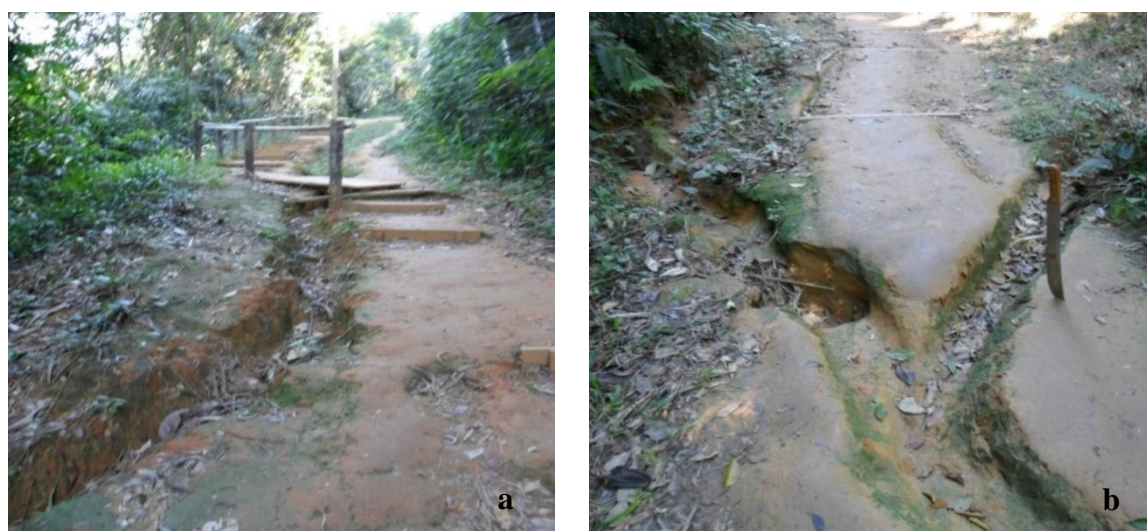
Figura 2. (a) Ravina desenvolvida com fluxo preferencial para a borda da trilha e acúmulo de serapilheira. (b) Ponte em cima de ravina no leito da trilha.

Na trilha foram observados pequenos movimentos de massa, áreas descampadas, desbarrancamento da encosta e feições erosivas, dois exemplos de feições erosivas no leito da trilha, estão destacados na Figura 2. Rangel (2014) destaca que essas ravinas estão associadas à concentração do escoamento superficial e a áreas com declividade acentuada.