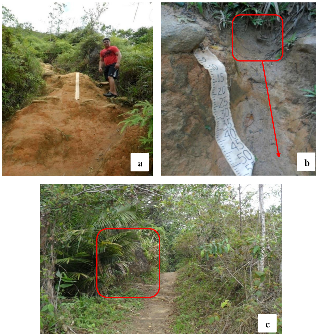
Figura 3. (a) Vista geral do primeiro ponto de coleta e canal preferencial de água que drena da área de borda para o leito da trilha (b); (c) Visão geral do segundo ponto de coleta com a presença de raízes no leito da trilha e de bloco rochoso (destaque em vermelho).

ponto 1 e com a presença de vegetação arbórea no ponto 2, que diminui o efeito splash no leito da trilha.